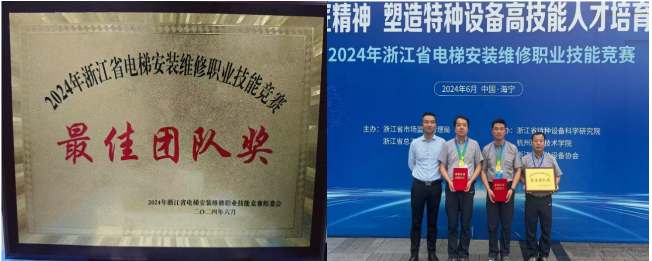
图 4 企业职工参赛获奖

在 2024 年“浙江省电梯维修职业技能竞赛”中，巨通电梯工匠队斩获“最佳团队奖”第一名，以及个人一等奖等多个奖项。以巨人通力人才培养体系为载体，公司与国内各大高校达成校企合作，先后与江西省商务技师学院、正德职业技术学院、河南机电职业学院和四川信息职业技术学院共建实训基地，建立“现代学徒制”、联合培养电梯工程技术人才。多年来，巨人通力不仅竭力为员工提供多元化的职业发展机会，更积极与各类优秀院校合作，依托院校专业教育资源，培养专业素质良好，同时兼备实践技能的新一代学生人才。