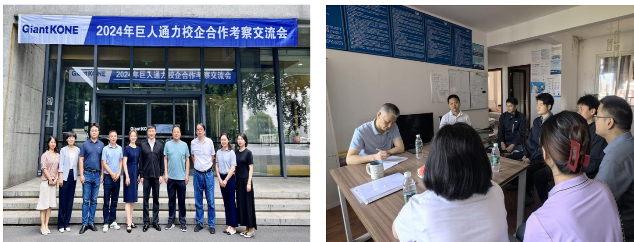
图 1 校企合作考察交流

公司与校方共同开展“学徒制专班”，发挥学校和企业各自优势的同时共同培养社会与市场需要的人才，校企双方互相支持、互相渗透、双向介入、优势互补、资源互用、利益共享，实现高校教育及企业管理现代化、促进生产力发展、加快企业自有人才的学历教育，使教育与生产可持续发展。