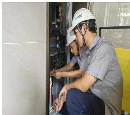
图 3 学生实践培训